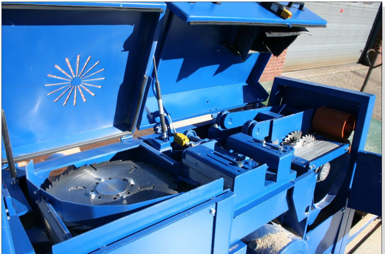
À gauche la StickApp Plus avec manchon horizontal pour le calibrage de l'épaisseur des planches et lattes