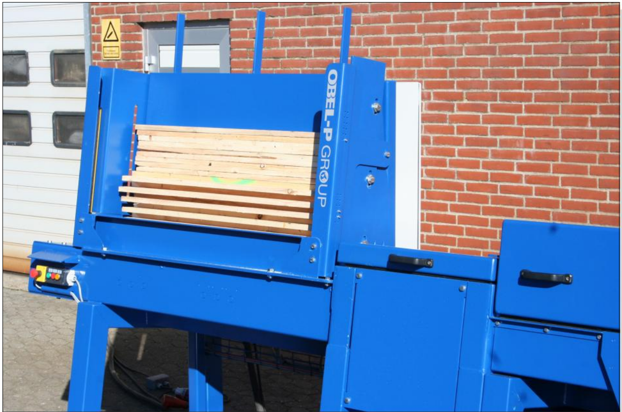
Magazin für die Brettzuführung. Unten die Einzugs-kette, ausgestattet mit Stahlmitnehmern