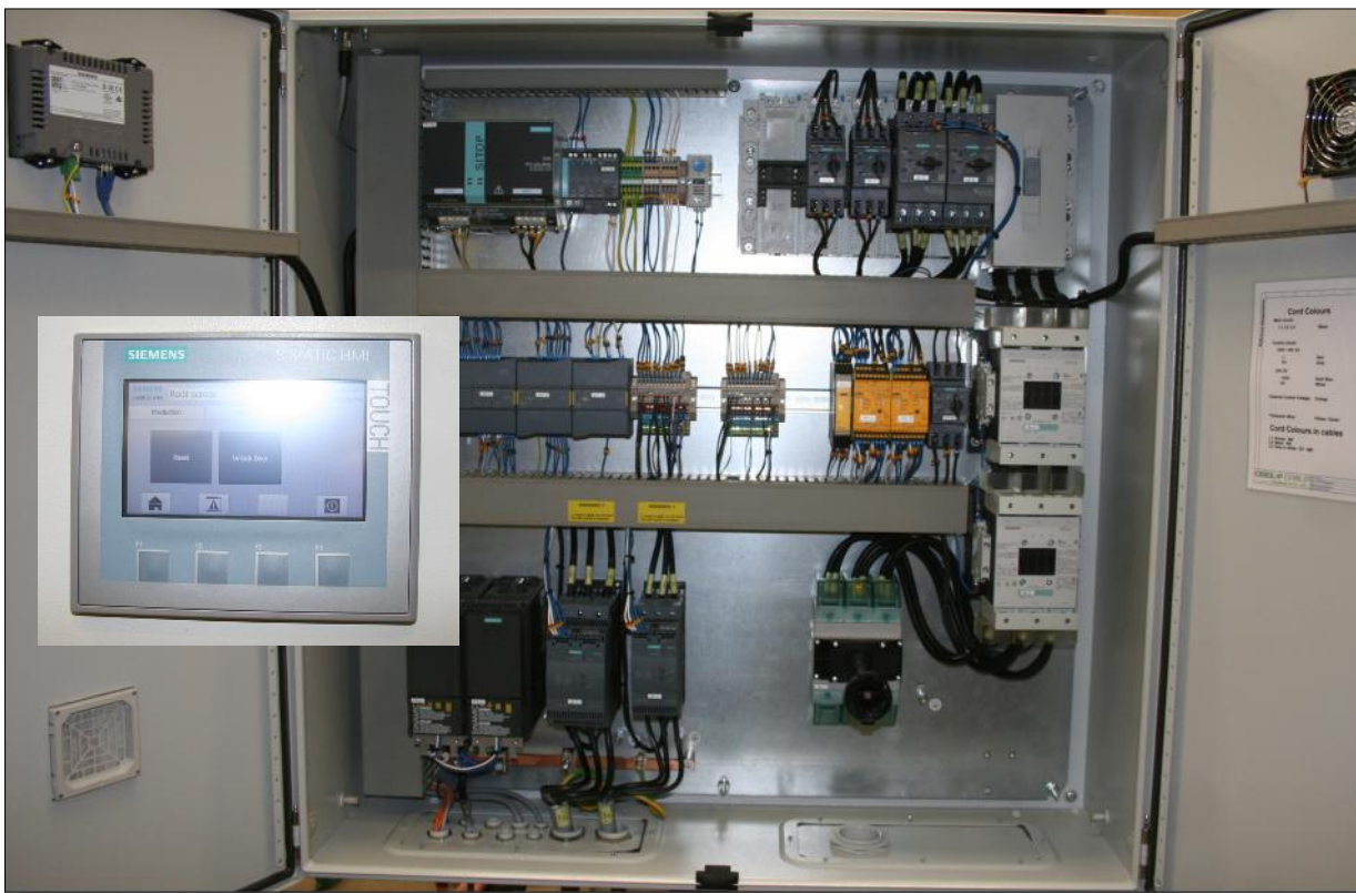
Schaltschrank. Einfügung : die HMI Einheit

Brødbæk & Co. A/S Mølgårdvej 1 DK-7173 Vonge Dänemark